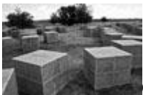
Село Россошки – военно-мемориальное кладбище.

Солдатское поле – мемориальный комплекс на трассе Волгоград-Москва. Из элементов: братская могила, девочка с васильком, треугольник письма, воронка с минами и снарядами, лемехи плугов.