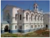
Усть-Медведицкий Спасо-Преображенский монастырь.

У западной части города Серафимович, недалеко от Дона, стоит Усть-Медведицкий Спасо-Преображенский монастырь. Основан в 1652 году, в советское время был разрушен, в 1992 году началось восстановление. Есть рукотворные пещеры.