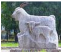
Памятник козе в Урюпинске

Рассказ «Босоногий гарнизон» рассказывает о реально живших мальчиках, организовавших партизанский отряд. Сейчас в хуторе Вербовка Калачевского района два мемориала: на месте расстрела и захоронения героев.