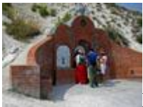
Белогорский Каменнобродский Свято-Троицкий монастырь.

Дубовский Свято-Вознесенский женский монастырь начинает свою историю с 1865 года, постепенно развиваясь. В советское время был закрыт, а сейчас снова восстанавливается.