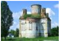
Покровский собор в станице Тишанская.

В поселке Горьковский находится родник деда Тарана, обладающий целебными свойствами и являющийся истоком Царицы. Необычным явлением у родника стало появление лика святого на камне.