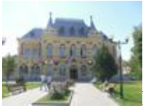
Камышинский краеведческий музей.

Камышинский краеведческий музей образован в 1961, находится в Земском доме 1901 года. Музей поделен на 14 залов с различными экспозициями.