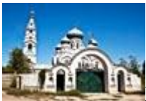
Храм Михаила Архангела в Ерзовке.

Свято-Троицкий храм, расположенный в станице Филоновская, был построен в 1728 году. В советское время был закрыт, использовался как склад зерна, но в 1965 году открылся и больше не закрывался.