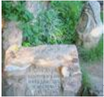
Родник деда Тарана - исток Царицы.

Станица Зотовская расположена в Волгоградской области, здесь несколько веков проживали казаки. Главная достопримечательность - православный храм «Знамение Божьей Матери».