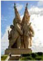
Монумент «Соединение фронтов».

На Шукшинском утесе снимался фильм «Они сражались за Родину», во время съемок которого умер Василий Шукшин. Сейчас здесь памятный символ, братская могила и часовня.