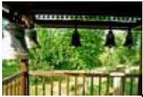
Дубовский Свято-Вознесенский женский монастырь.

Дубовский Свято-Вознесенский женский монастырь начинает свою историю с 1865 года, постепенно развиваясь. В советское время был закрыт, а сейчас снова восстанавливается.