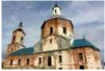
Станица Зотовская, храм «Знамение Божьей Матери».

Станица Зотовская расположена в Волгоградской области, здесь несколько веков проживали казаки. Главная достопримечательность - православный храм «Знамение Божьей Матери».