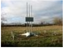
Места боевой славы - Волго-ахтубинская пойма

Памятники и места боевой славы, посвященные Сталинградской битве и находящиеся в Волго-ахтубинской пойме: штаб Юго-Восточного фронта (хутор Ямы), памятник в деревне Тумак и другие.