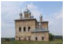
Свято-Вознесенской Кременской мужской монастырь.

Более 100 лет назад в селе Гусевка Волгоградской области возник Гусевский Ахтырский женский монастырь. В этих местах художник Петров-Водкин писал свою картину под названием "Купание красного коня".