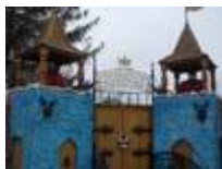
Парк-музей русской сказки имени А.С. Пушкина

Культурные, исторические достопримечательности и памятники Волгоградской области.