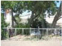
Мемориал «Босоногий гарнизон».

Монумент «Соединение фронтов» создан Евгением Вучетичем и символизирует встречу двух фронтов, которая завершила операцию «Кольцо» и окончание Сталинградской битвы. Находится в поселке Пятиморске Калачевского района. Там же вы можете посетить музей .