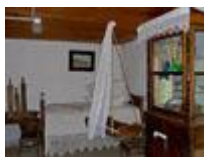
Этнографический музей казачьей народной архитектуры и быта

Музей русской сказки: Емеля и царевна-лягушка, Кощей бессмертный и русалка, Соловей-разбойник и Балда – всех этих сказочных персонажей можно увидеть в музее русской сказки, находящемся в поселке Кировец.