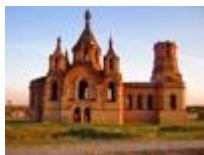
Храм Николая Чудотворца в станице Голубинская.

Изначально храм Михаила Архангела в Ерзовке был деревянным, в 1896 он был выстроен из камня. В советское время храм был закрыт, здесь был склад для хранения зерна и соляной кислоты. В последнее время храм Михаила Архангела в Ерзовке восстанавливается.