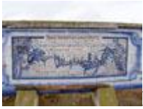
Царицынская сторожевая линия

Памятники и места боевой славы, посвященные Сталинградской битве и находящиеся в Волго-ахтубинской пойме: штаб Юго-Восточного фронта (хутор Ямы), памятник в деревне Тумак и другие.