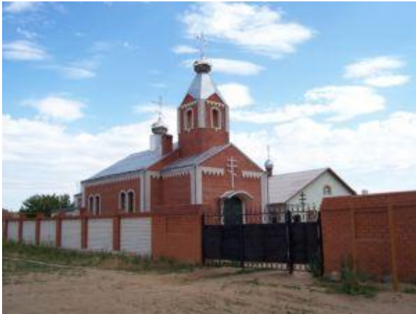
Гусевский Ахтырский женский монастырь.

У западной части города Серафимович, недалеко от Дона, стоит Усть-Медведицкий Спасо-Преображенский монастырь. Основан в 1652 году, в советское время был разрушен, в 1992 году началось восстановление. Есть рукотворные пещеры.