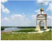
Шукшинский утес в Клетском районе.

На Шукшинском утесе снимался фильм «Они сражались за Родину», во время съемок которого умер Василий Шукшин. Сейчас здесь памятный символ, братская могила и часовня.